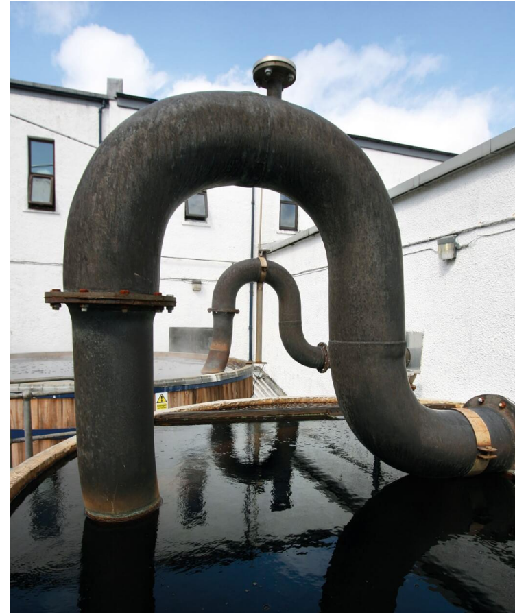
Den väldigt speciella formen på sista delen av lågvinpannornas lynearm