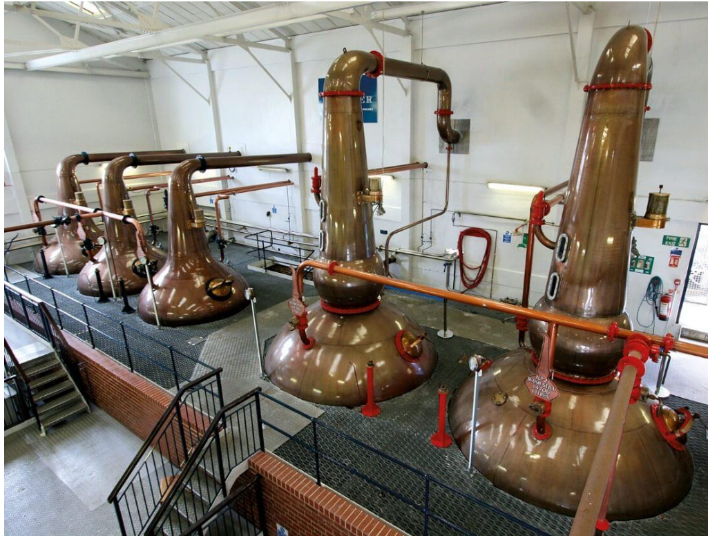
De två lågvinpannorna till höger och de mindre Spritpannorna till vänster.